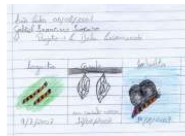
Fig 1. Registro da metamorfose

As principais questões foram: Como a borboleta vive? Como se transforma? Como ela se reproduz? Quanto tempo vive? Como descobrimos se ela é macho ou fêmea?