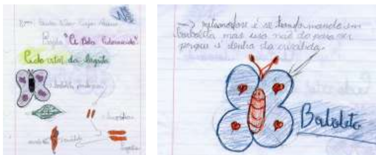
Figuras 3 e 4. Registro do ciclo vital da borboleta

As verificações das hipóteses se deram através das observações e pesquisas nos materiais já citados. Entre os registros feitos, um deles foi conclusão de como se dá o ciclo vital da borboleta, como mostram as figuras abaixo (3 e 4):