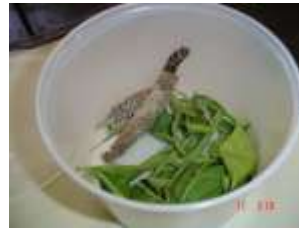
Foto 1. Bicho-do-cesto

Durante meses isso ocorreu despertando mais curiosidade: “Será que nossa Bela Adormecida vai se transformar em borboleta? Ou será mariposa? Por que ela sai e em nada se transforma? Será que haverá metamorfose?”